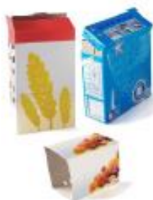
Boîtes et suremballages en carton