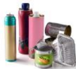
Boîtes de conserves, aérosols, canettes en aluminium, couvercles de pots