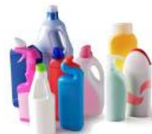
Bouteilles, bidons et flacons de produit d'entretien et d'hygiène